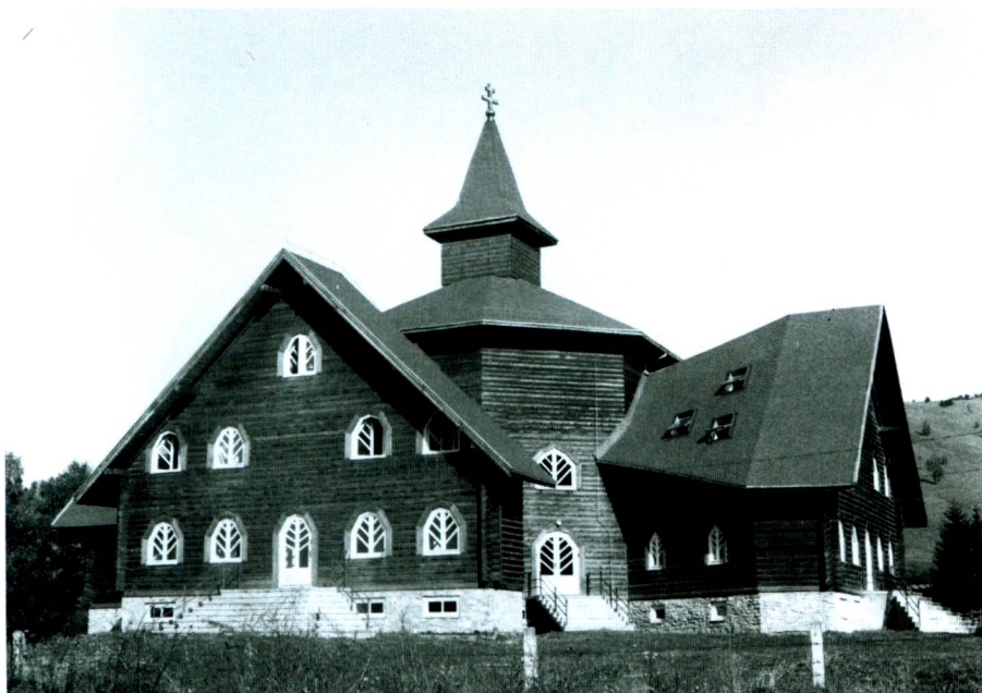
A gyimesfelsőlóki Árpád-házi Szent Erzsébet Líceum (Bárth János felvétele, 2001)