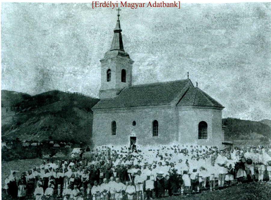
A gyimesfelsőlóki templom ünneplő csángókkal (Ismeretlen szerző felvétele a XX. század elején, valószínűleg 1908-ban. GYIFELOPI)