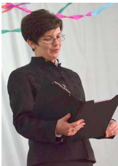
Márton Zsuzsanna, Egri polgármestere