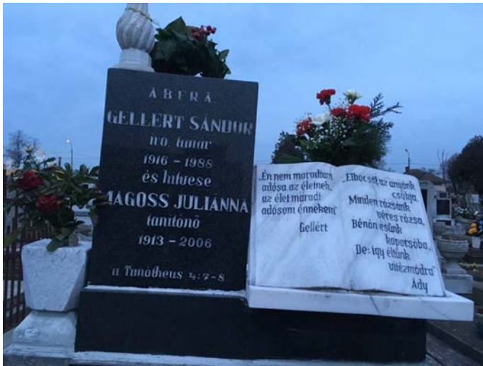
Gellért Sándor síremléke Szatmárnémetiben