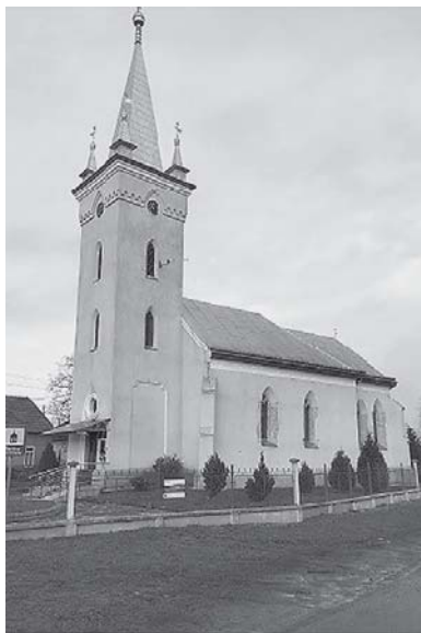
Az egri református templom