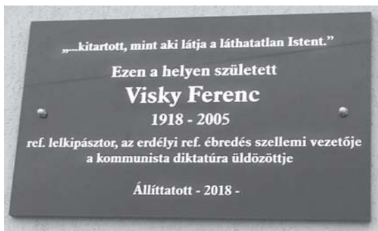
Emléktábla az Egri Református Parókia falán

Óhajom beteljesült, mert a régió magyarsága megelégedésére és örömeire az emléktábla elkészült a centenáriumi évében, Egri-ben. Az ünnepségen jelen volt a Visky család, a református egyház megyei vezetői, valamint az anyaország prominens alakja, a külföldi magyarság védelmezője, Németh Zsolt parlamenti képviselő (FIDESZ).