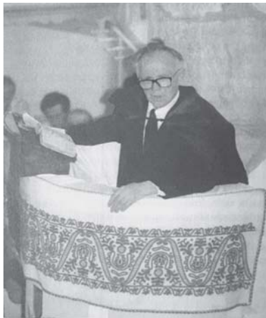
Ötven év után ismét az egri szószéken

Róla így emlékezik lelkész testvére: „Pár nappal ezelőtt szülőfalunkban, lelkész édesapám parókiáján mint katonaszökevényt fogták el. Katonaszökevénynek golyó általi halál túl elegánsnak számított. A nyilaskeresztesek ezért fára aggatták őket. Öcsémet édesapánk tekintélye