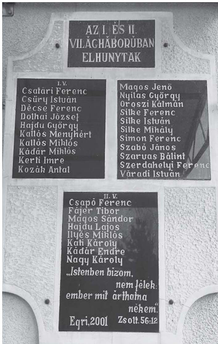
Az I. és II. világháborúban elhunytak névsora a templom falán