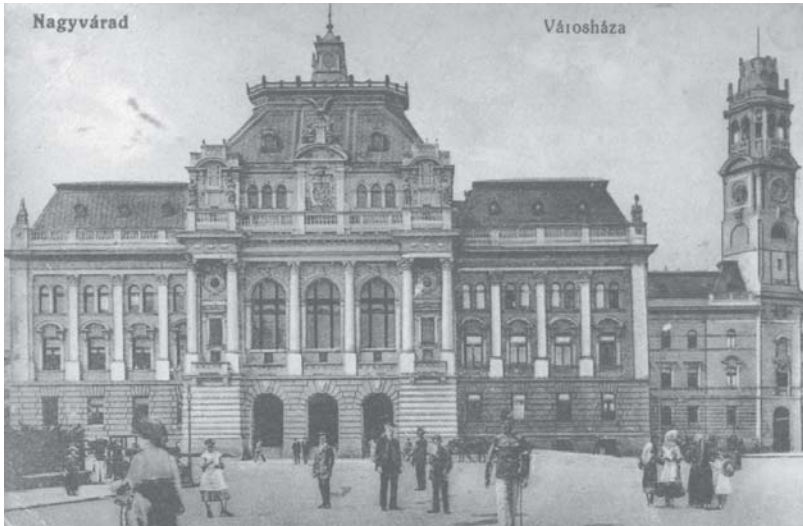
Az impozáns épület főhomlokzata

mely ígérkezett. Mi csak konstatálni tudjuk, hogy az új székház monumentális, hódító. Éreztetni a szemlélővel azt a definíciókba nem férő gazdag, titkos, elragadó érzését, melyet csak az igazi művészet tud felébreszteni. És ahogy bejárjuk a fölforgatott, a készülő, a modern városalapítók lázában égő Nagyváradot, úgy érezzük, hogy az új székház méltó arra, hogy hozzáépüljön a jövőendő Nagyvárad... 91