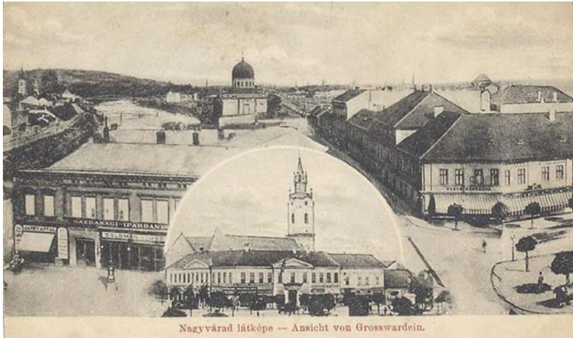
Nagyvárad látképe — Ansicht von Grosswardein.

Ha azonban az új díszes templom a reáliskola telkén egy terasz-szerű parkban felépül, mögötte az új utcában az új plébánia, és