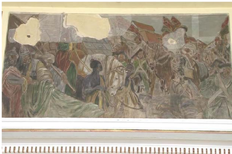
Részlet a falképből