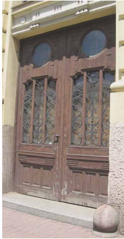
A városháza két bejárata a Teleki (ma Primăriei) utcáról

városháza. És mit minden hozzáértő szakember meg tud ítélni, az ország egyik legolcsóbb székháza. Hétszázezer koronánál többet nem áldozhatott rá a város, szinte lehetetlen, hogy ennyi pénzből ily ízlésesen, minden várapozást fölülmúló módon tudta azt fölépíteni ifj. Rimanóczy Kálmán, akinek munkáját és számításait az építkezés tartama alatt annyi előre nem látható baj és munkássztrájk zavarta meg.