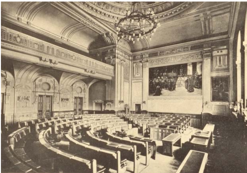
Az új székház közgyűlési terme (archív felvétel)

Nagyon szépen és ízlésesen oldották meg annak idején a díszterem faliképeinek, mennyezeti freskóinak (mert azok is voltak), stukkódíszeknek a harmóniáját. Az ifj. Rimanóczy Kálmán által tervezett bútorzat is méltó volt a terem visszafogott eleganciájához. Sajnos erre már csak egy korabeli fénykép emlékeztet, mert mindez a második világháború során elpusztult. Akkor melegebben, a jó szándéktól vezérelve, egyszerűsített formában állították helyre a dísztermet. Az ellenben már felróható a városvezetésnek, hogy azóta sem állították vissza a tervrajzok, archív felvételek alapján a díszteremben uralkodó korabeli állapotokat. A díszterem központi kupolaszerű részét freskó díszítette. Minderről mi is csak most szereztünk tudomást a korabeli lapokból. Ott írták, hogy 1903 áprilisában már javában dolgoztak a nagy közgyűlési terem díszítésén. A mennyezet