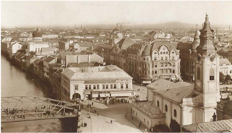
Szent László téri panoráma

megfelelő új épületek a fennmaradó telken, ha a Fekete Sas helyén egy kétemeletes új városháza felépül a tér felé monumentálisan kiképzett homlokzattal, a megfelelő bejáratokon s csarnokokon felül megmaradó utcai részeken értékes bolthelyiségekkel; ha a jelenlegi templom el lesz bontva: akkor a ma szegényesen kinézű egész tér, környéke még méltóbb lesz mint társa a Bémer tér... 37