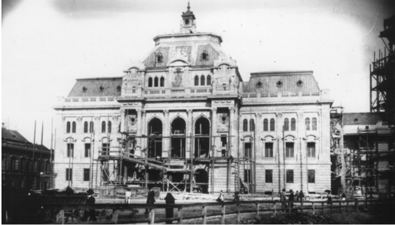
Részen már leszedték az állványokat az új épület elől (archív felvétel)

helye, a hallgatóság számára pedig karzat készül. Az ellenőrző bizottság úgy találta, hogy a bejárat nem fog teljesen megfelelni, ezen pedig úgy akar segíteni, hogy a karzatot tartó oszlopokat eltávolítják, miáltal a terem sokat fog nyerni.” 76 Az átalakítást az ellenőrző bizottság támogatta, és a javaslatot jóváhagyás végett a közgyűlés elé terjesztette.