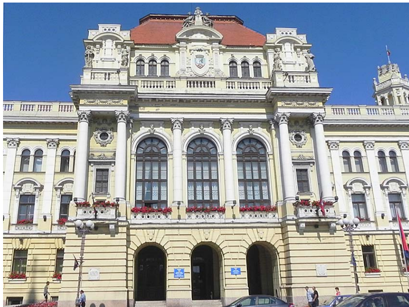
A városháza főhomlokzata