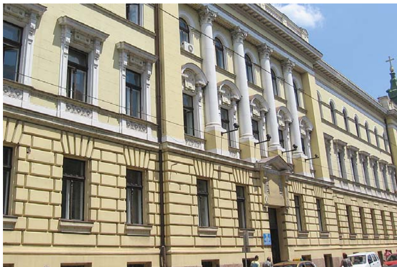
A Teleki utcai homlokzat