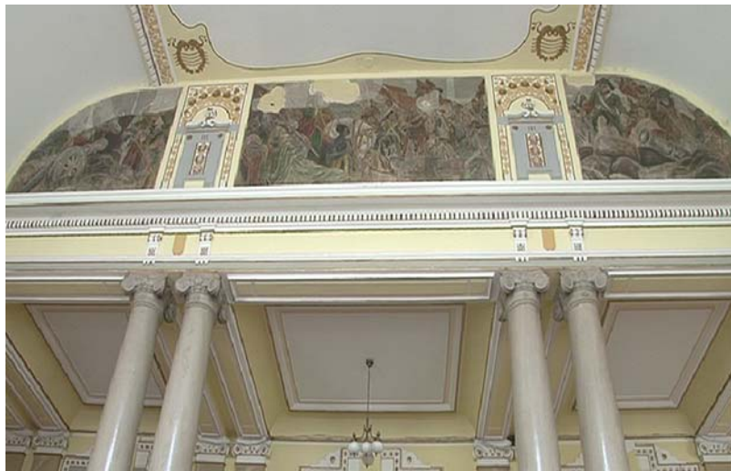
A lépcsőház falán újra látható falképek