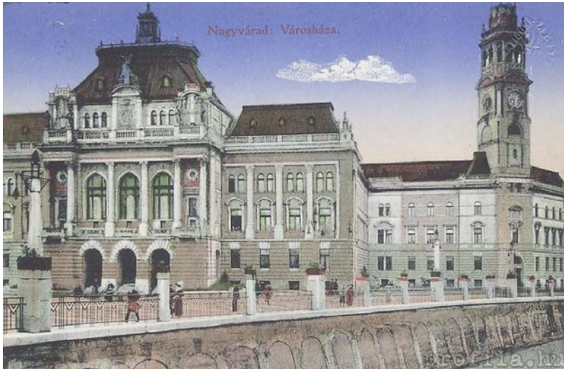
A városháza Körös felőli képe

összes hivatali szobák várják majd a bevonuló hivatalnokokat az új bútorzattal. 95 Végül majd csak november 23-án kezdtek el hurcolkodni a hivatalnokok, elsőként a levéltárat költöztették. 96