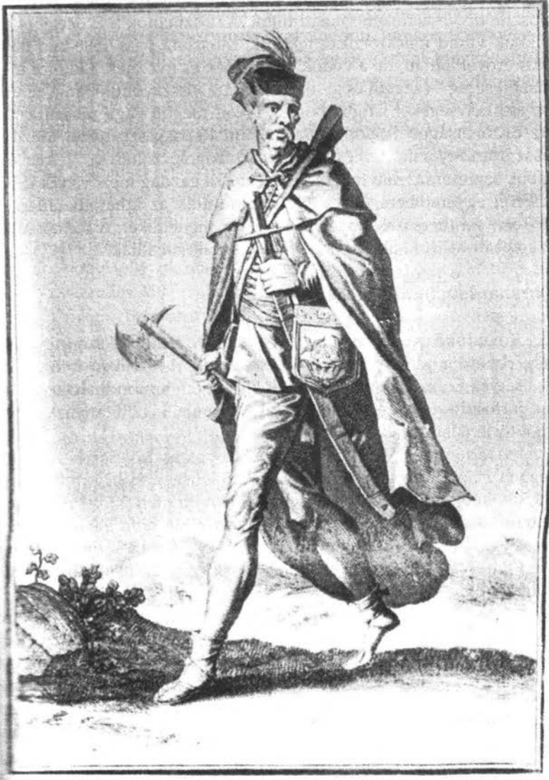
„Isten felkölté a hajdúkat“