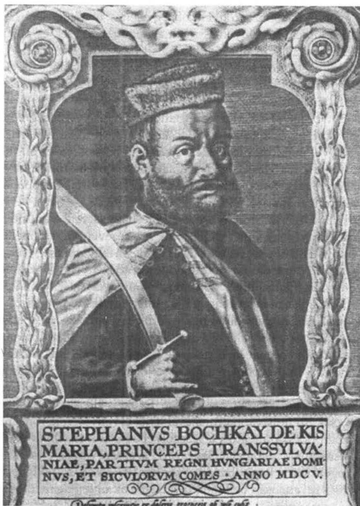
Bocskai István. A tallérjaira vert képmás alapján készült metszet, 1605

Bocskai már november 11-i kassai bevonulása előtt felveszi az „Isten kegyelméből Erdély fejedelme, Magyarország részeinek ura és