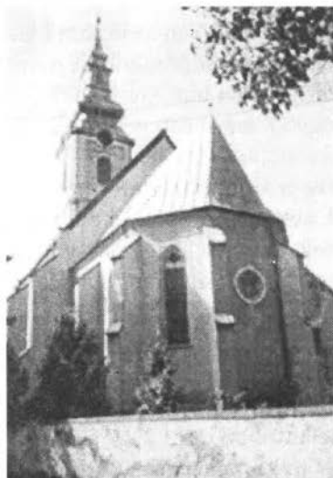
A mezőtelegdi templom műemlékileg legértékesebb gótikus része

Bocskai István bár nem vetette meg az élet mindennapi örömeit, de a fő foglalatosságai mégis a politizálásban, katonáskodásban, a közügyekkel való bajlódásban és nem utolsósorban birtokai igazgatásában merült ki, amelyben a tisztartók, sáfárok, udvarbírák mellett a felesége nagy segítségére volt. A hitvestárs a kor szokása szerint, minden bizonnyal szívesen lovagolt, vadászott és agarászott. A főúri asszonyok egyik kedvtelése volt ez.