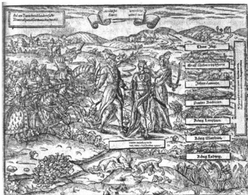
Magyarország két ellenség között

századvégi nagy török elleni tervei nyilván Báthori István koncepciójának a lecsapódásai, egy egészen más hatalmi helyzetben, Lengyelország kiesése miatt Habsburg segítséggel, ami aztán bukásba viszi a terveket.” 2 Báthori Kristóf 1576–81 között vajdaként kormányozta Erdélyt, lengyel királlyá választott bátyja nevében. Halála előtt néhány nappal kiskorú fiát, Báthori Zsigmondot választotta utódjául, aki nagykorúsítása után, 1588-ban vette át Erdély kormányzását. Zsigmond a jezsuitáknál nevelkedett, humanista szellemenben. Kitűnően beszélt latinul és olaszul. Gyulafehérvári udvara a zenei élet központja volt, ahova a toszkánai nagyhercegtől hozatott zenészeket. Ám mint uralkodó, tehetetlen és szeszélyes volt, amivel súlyos károkat okozott Erdélynek. Nyolc év alatt négyszer mondott le a fejedelemségéről, háromszor különösebb erőfeszítés nélkül vissza is vette azt, „akár egy játékszert, amelyhez újból kedve támadt”. Az esszéista Cs. Szabó László írta róla: „Tragikus bohóc volt és nem tragikus hős. A szenvedélyes műkedvelő sorra beleunt szerepeibe, a