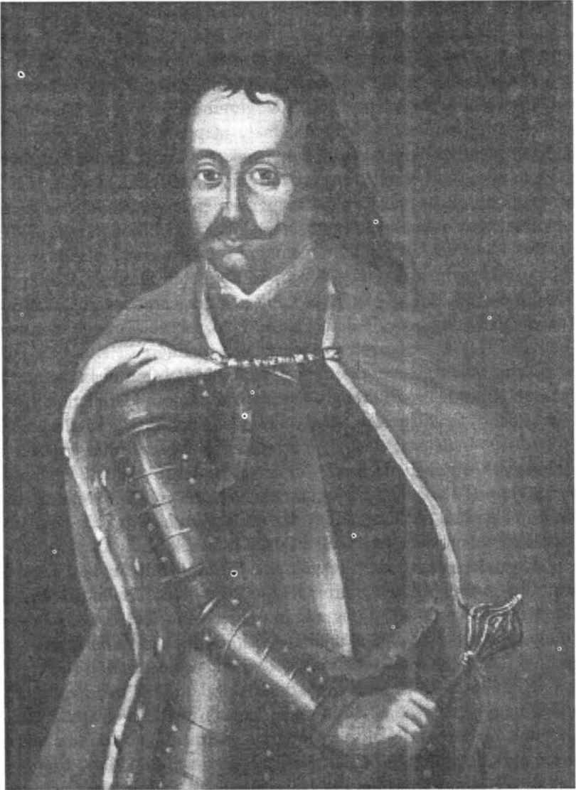
II. Rákóczi Ferenc portréja. Ismeretlen festő