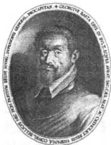
Giorgio Basta mellképe

Egyre fokozódik a katolikus restauráció. A császári Hadi Tanács katolikus németeket szándékozott Debrecen környékére telepíteni. VIII. Kelemen pápa pedig felszólította I. Rudolfot, hogy Erdélyben állítsa vissza a katolikus vallás egyeduralmát. Giorgio Basta 1604 tavaszán elhagyta Erdélyt, kíséretében kincsekkel, arannyal megrakott társzekerek. Az országban maradt az éhínség, a járvány, a szegénység. A krónikák szerint az igásállatoktól megfosztott emberek pusztá erejükkel szántották a földet, maguk húzták az ekét vagy a kétkerekű taligát. Bod Péter szerint ekkor honosodott meg a „Basta szekere” szóláshasonlat.