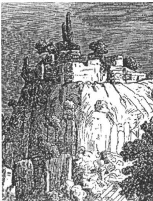
Sólyomkő várának romjai – 19. század