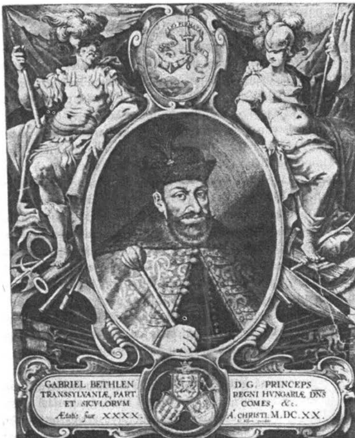
Bethlen Gábor. Lucas Kilian metszete, 1620

A Bocskai István halálát követő hét évben Erdélynek két fejedelem is volt, de csak egy igazi államférfija. Az, aki 1603-ban Basta rémuralmának megtörésére nemcsak a török támogatást szerezte