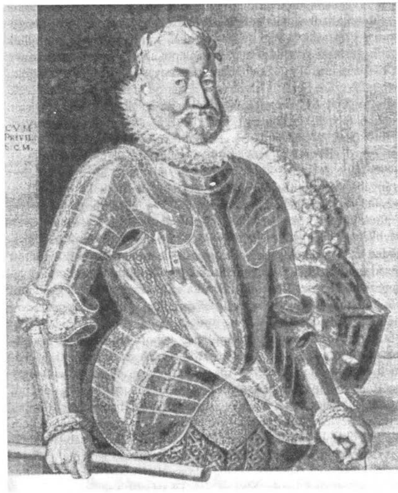
Rudolf császár és király kedvelt spanyol divatú ruhában

Báthori Zsigmond 1597 elején, Bocskai társaságában Prágába érkezett, hogy lemondása feltételeiről tárgyaljon I. Rudolf-fal. Az egyez-