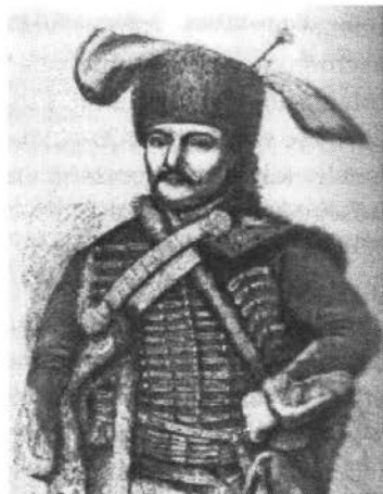
Károlyi Sándor (fametszet, 19. század)

tette. Forgách, aki előkelő származásának tudatában a fejedelem (és legfeljebb még Bercsényi) után magának kívánta a legfőbb pozíciót, úgy érezte, hátrányba kerül a többiekkel szemben, ha az országos főkapitányságok közül egyet sem sikerül megszereznie, miközben „idegen földön” szolgálja Rákóczit. Forgách tehát Váradot Magyarország részének tekintette, de gyakorlatilag ő is éppen a Partium „természetes szerepét” kívánta helyreállítani, amikor bejelentette igényét a váradi főkapitányságra. Ezzel ugyanis a fejedelemség „védőzónája” és Erdély egyaránt az ő parancsnoksága alá került volna.