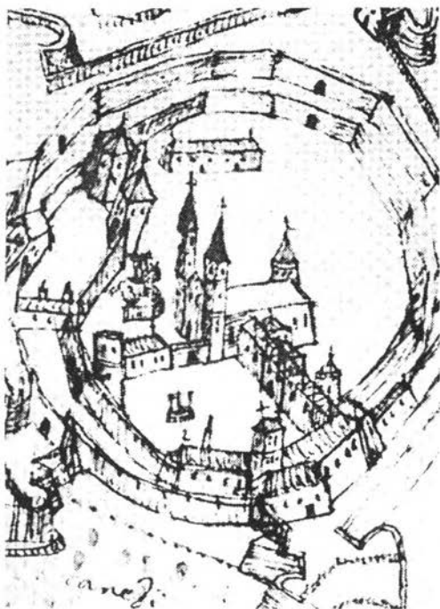
Váradi középkori vára a székesegyházzal és a püspöki palotával (Cesare Porta rajza, részlet, 1598–1599 körül)

Báthori István 1581-ben a székesegyházat részben katonai raktárrá, részben tüzérségi állásá alakította át. 281 A székesegyházzal tovább nem törődnek, Houfnagel 1598-ban készített metszetén a szentély már nem látható. A kis északkeleti torony is rövidesen megsemmisülhetett, ugyanis Miskolcзы István naplója, valamint az 1600. évi leltár már csak a két nyugati tornyot említik. 282 Hogy a két nyugati toronyról esett szó, azt egy 1600-ban kelt tudósítás is megerősít, amely ikertornyokat említ. 283