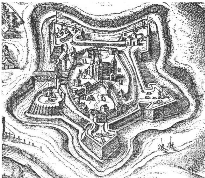
A váradi vár látképe felülről (Részlet Georg Houfnagel rézkarcáról 1598–1599 körül)