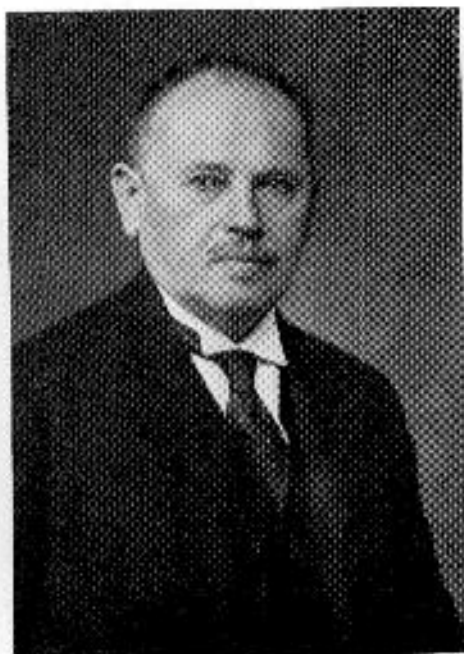
Buday Kálmán 1863—1937