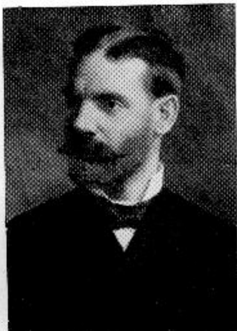
Plósz Sándor 1846—1925