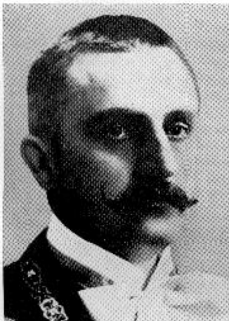
Richter Aladár 1868—1927