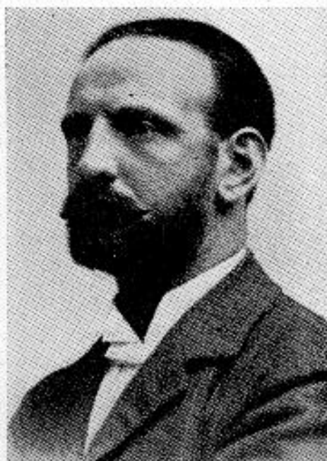
Apáthy István 1863—1922