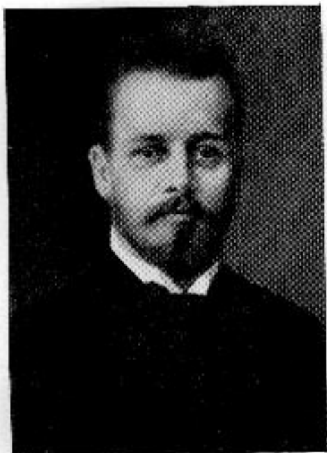
Concha Győző 1846—1933