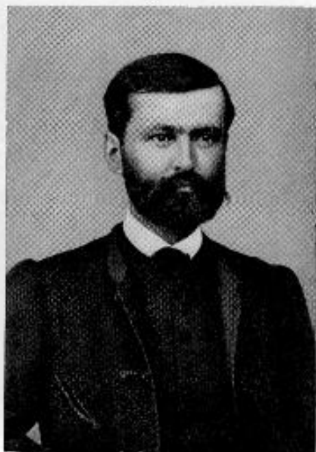
Torma Károly 1829—1897

ügyszólván úttörő vállalkozás volt. Kolozsvárt nyert először katedrát minden idők egyik legkiválóbb nyelvtudósa, Gombocz Zoltán (1877—1935) is. Pótolhatatlan kára a magyar és az európai tudományosságnak, hogy Gombocz termékenysége nem állott arányban ritka képességeivel s korai halálával sok mindent magával vitt a sírba, amit nehéz munkával újabb tudósnemzedékeknek kell pótolni; magyar történeti nyelvtanát egyetemi jegyzeteiből csak most adják ki. Hogy oly keveset írt, annak magyarázata részben tehetségének természetében rejlik: a klasszikus, finn-ugor, magyar, török, román, germán nyelvészetben egyaránt otthonos lévén, aránylag ritkán adódtak számára a „termékeny korlátoltság“ pillanatai, vagyis olyan pillanatok, mikor minden oldalról igazoltnak látszott az, amit le akart írni. Kevés számú, szűkszavú műveiben klasszikusat alkotott. Érdeme, hogy nálunk elsők között propagálta a nyelvlélektani módszert; „Nyelvtörténeti módszertana“ mintaszerű kézikönyv; a Melich Jánossal együtt szerkesztett „Magyar Etymologiai Szótár“ nélkülözhetetlen alapvető munka. Noha romanisztikával csak fiatal korában foglalkozott, egyike volt azon keveseknek, akik tudományos érdemeikért elnyerték a francia becsületrendet.