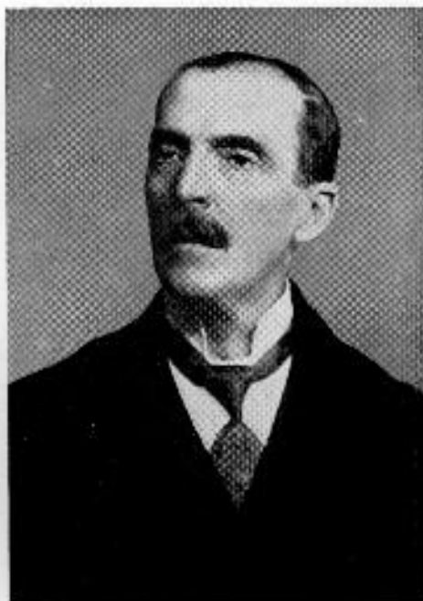
Némethy Géza 1865—1935

pontok ókortudományi fontosságát s azokat műveiben nagy sikerrel alkalmazta. Torma Károly (1829—1897) ugyan a közjog professzora volt Kolozsvárt, de Pestre felkerülvén, az archeológia tanára lett s mint ilyen, csakhamar kitűnő nevet szerzett magának külföldön is; Aquincum feltárása, részben a leletek feldolgozása, valamint az aquincumi múzeum megszületése köszönhetők fáradhatatlan munkásságának; hosszú évekig kutatta a római Dácia archeológiai kincseit s azoknak mintaszerű leírását adta; főmunkatársa volt — a dáciai anyagban — Mommsen híres epigrafiai gyűjteményének ( Corpus Inscriptionum Latinarum ); ez utóbbi szerepe — számos külföldi publikációja mellett — nagy dicsőséget szerzett a magyar tudományosságnak.