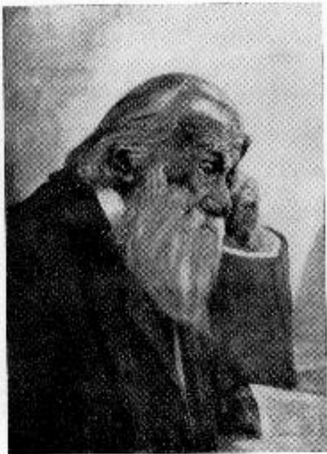
Brassai Sámuel 1800—1897

mok keretei közé : egy-egy végső eredménye néha évtizedekkel korábbi gondolatokra, élményekre utal vissza. Harmadsorban pedig ilyen szemléletre késztet az a fogalmilag nehezen körülírható benyomás is, mely egyre inkább erősödik abban, aki a kolozsvári egyetem évkönyveit elfogulatlanul lapozza : hogy volt ennek az egyetemenek valaminő sajátos hangulata, egyéni couleur locale-ja, mely félreismerhetetlenül rányomta bélyegét az itt dolgozó tudósok legtöbbszörének egyéniségére.