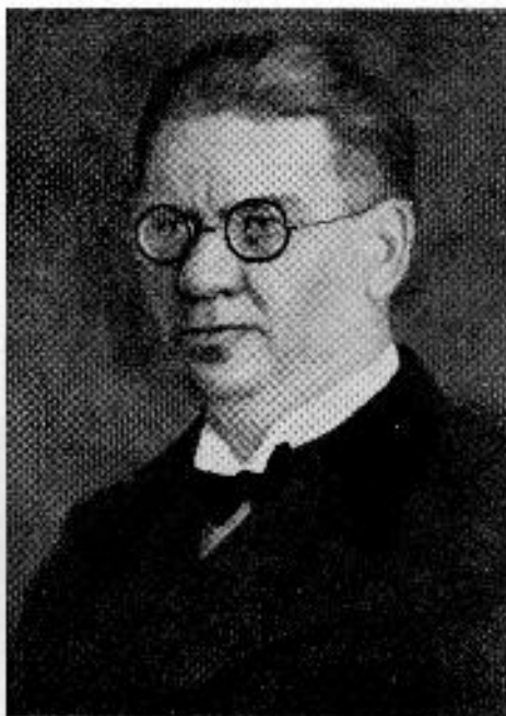
Pauler Ákos 1876—1933

Valószínűnek látszik, hogy Böhm Károlynak reális hatása is volt a modern lélektanra, de nem közvetlenül, hanem tanítványán és magántanárán, Palágyi Menyhért en (1859—1924) keresztül. Böhm lélektanának a „képek“-re vonatkozó fejezetei ugyanis nyilván erős hatással voltak a később idegenbe szakadt Palágyira, aki szintén a lélektan alapvető ismeretelméleti problémáival foglalkozik. (Neue Theorie des Raumes und der Zeit. Leipzig, 1901; Naturphilosophie. Vorlesungen ü. die Grundprobleme des Bewusstseins und des Lebens. Charlottenburg, 1907, v. ö. G. Uphues: Zur Krisis in der Logik, eine Auseinandersetzung mit Melchior Palágyi. Leipzig, 1903.) Palágyit