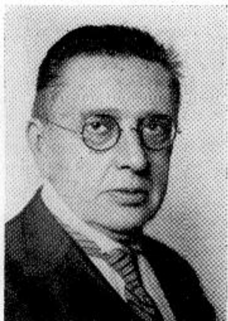
Tangl Károly 1862—1940