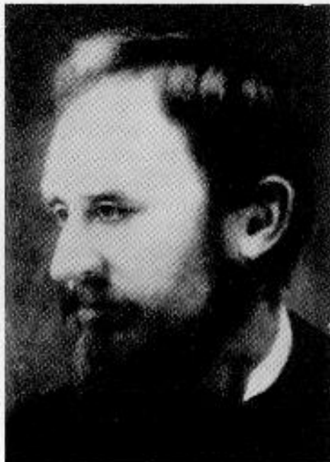
Meltzl Hugó 1846—1908