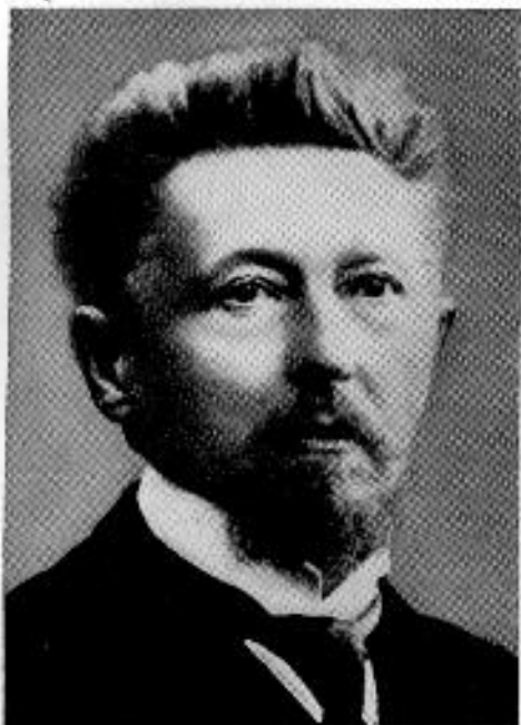
Szinyei Fózsef sz. 1857