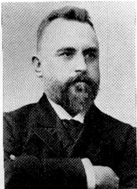
Hógyes Endre 1847—1906