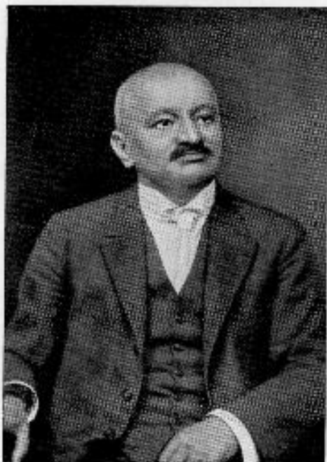
Hornyánszky Gyula 1869—1933