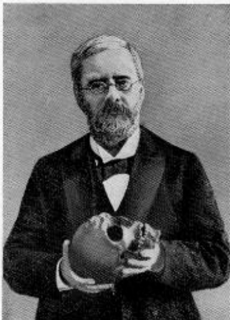
Török Aurél 1842—1912

hajtani az emberi koponyán ; törekvései a kraniometria megreformálására irányultak s kitartása, tudományos nagyigényűsége végül is sikerre vezettek. „Török Aurél — úgymond Bartucz Lajos — győzött. Nem túlzásával, nem a 6000 mérettel, hanem azzal, hogy felrázta tespedéséből a kraniometriát s diadalra segítette a modern antropológiai módszerek kifejlődését. Az ő módszeréből lett részben a mai variációs-statisztikai módszer, elmés mérőeszközeinek nagyrésze pedig ma is párját ritkítja . . . Török Aurél valóban a kraniologia reformátora volt s külföldön nagy dicsőséget szerzett a magyar névnek.“ Mindezek kellő méltánylásához tudnunk kell, hogy eredményeit nem kisebb európai tekintélyek kezdeti ellenzésével szemben kellett kivívnia, mint aminők Virchow vagy Kollmann voltak.