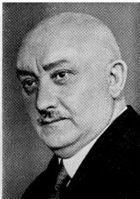
Gombocz Zoltán 1877—1935