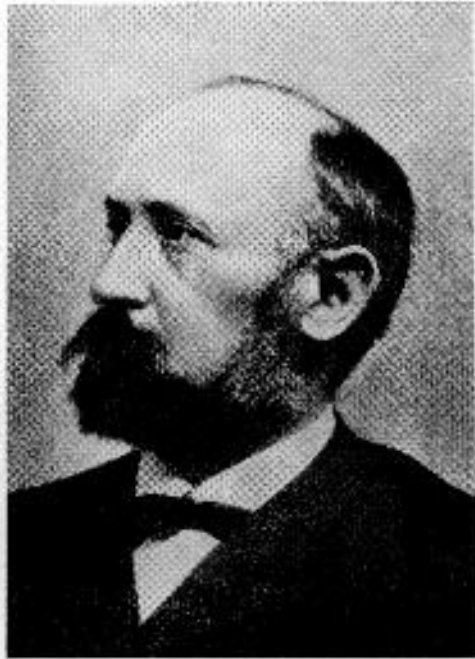
Böhm Károly 1846—1911

ménnyel. Azt szokták mondani, hogy valamely egyetem filozófiaprofesszora — ha valóban erős egyéniség — meghatározza az egész egyetem szellemi beállítását (amint pl. a berlini egyetem alapjellegét egykor valóban Hegel adta meg). Ha a Kolozsvárt folyó tudományos munka alapjellegét helyesen láttuk fentebb valaminő aktív idealizmusban, akkor a kolozsvári egyetem két nagy filozófusa — Böhm Károly és Pauler Ákos — valóban híven fejezték ki ezt az alapjelleget. Böhm Károly (1846—1911) volt az első önálló magyar filozófiai rendszer megalkotója. Tanítása valóban idealizmus, a szónak mind ismeretelméleti, mind pedig axiológiai értelmében. Munkásságában pedig élete végéig fellelhető az az aktivitás, mely igaza tudatában nem riad vissza semminő tekintély megbírálasától sem. Hogy Zsilinszky Mihályt, Klamarik Jánost, Névy Lászlót vagy Bihari Pétert keményen megbírált, azon ma már nem csodálkozhatunk. De meglepő, hogy szembeszállt nem kisebb tekintéllyel, mint Greguss Ágosttal is és — vele szemben is igaza volt. Fő kifogása, hogy Greguss írásai nem állanak korszerű európai színvonalon s Rosenkranz és F. T. Vischer meghaladott tanítására támaszkodnak: Greguss „régiben él, eszmeköre a filozófiai jelenkorban elavult“ (Greguss Á. „Tanulmányai“: Ellenőr IV. évf. 300—301. sz.). Hogy ez az erős kritikai hang Böhm részéről valóban jogosult, azt igazolja az, hogy saját tanítása valóban a legmodernebb európai színvonalon áll s még itt is éppen a legfrissebb kezdeményekkel áll