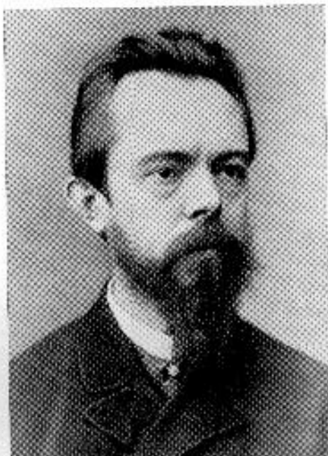
Fodor József 1843—1901