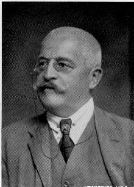
Szádeczky Kardoss Lajos 1859—1935

kolozsvári egyetemen fejtették ki azt a hatalmas nemzetnevelő munkát, melynek igazi súlyát és jelentőségét alig lehet túlbecsülni.