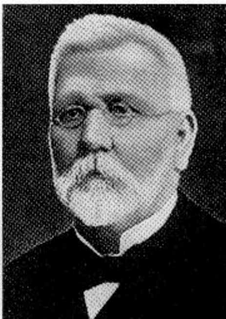
Borbás Vince 1844—1905