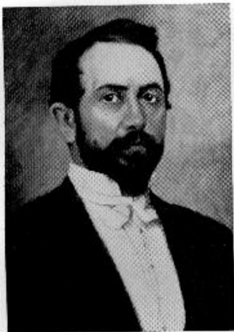
Hóman Ottó 1843—1903