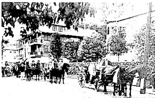
Lakodalmas menet a fürdő telepen.

A földreform nem érintette lényegében a helyi birtokviszonyokat, azonban mégis nagyjelentőségű következményei voltak Szovátn: a fürdotelepen kisajátított telkek román igénylok kezébe kerültek, megkezdődött a birtokviszonyok átalakítása és az állami tulajdonba került telkeken az új tulajdonos réteg számára felépülhettek a görög keleti és görög katolikus templomok, állami tanítók 10 ha telepítési telket kaphattak a kultúrzónákat létrehozó 1924-es elemi iskolai törvény értelmében.