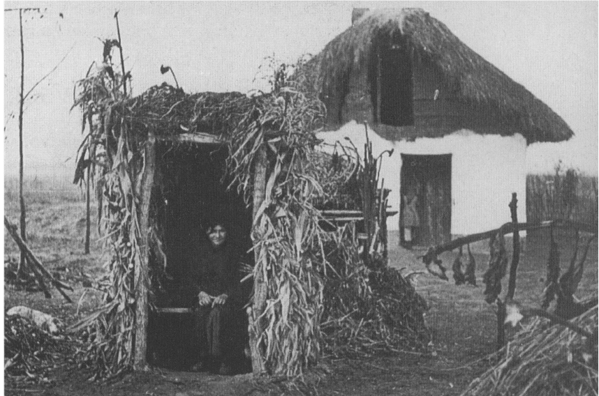
...ahhoz, hogy élni tudjanak, ahhoz, hogy élni hagyják őket, elfogadják a megfelelés követelményeit... (Képek egy tanácsi fotóalbumból, 1957)