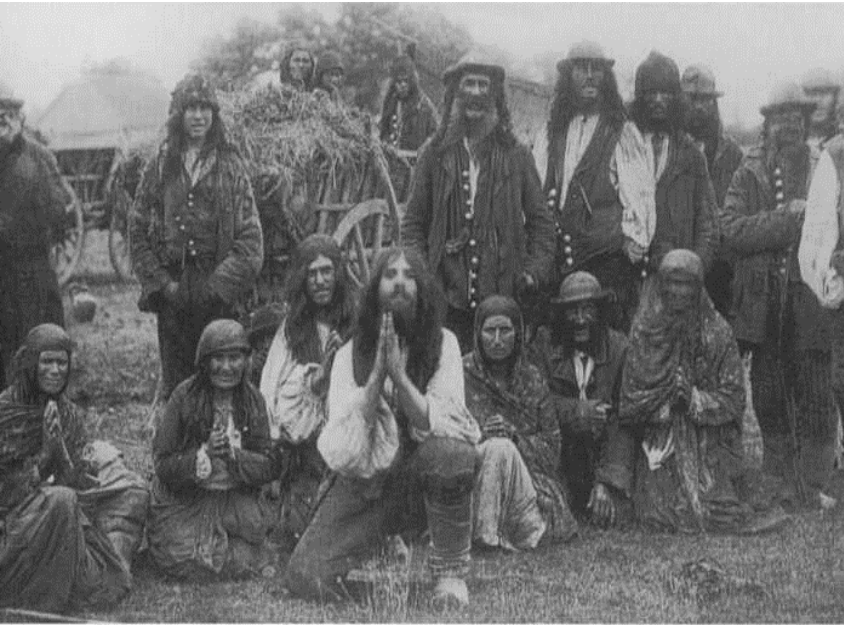
Magyarországon mind, a mai napig a cigányoknak mondott társadalmi csoportokkal szemben hatalmas előítélet-rendszer működik (Nagyszokolyai Béla gyűjtése, Dályok, 1895)