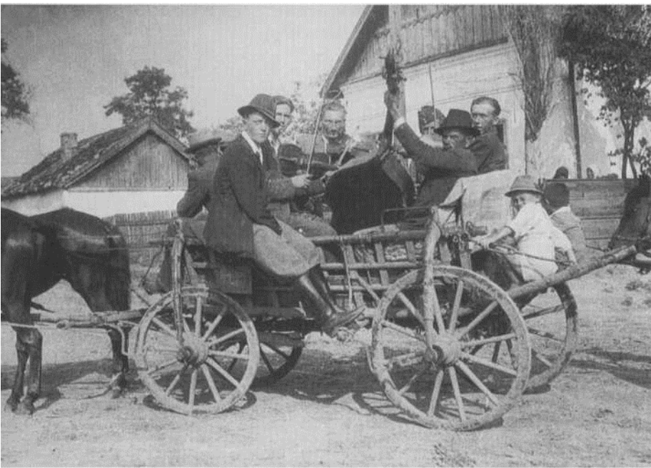
A magyar cigányok inkább használják magukra a muzsikus megjelölést, a velük szolidáris értelmiség pedig a roma megnevezést (Keszegh István felvétele, Tiszaigar, 1949)

A nyolcvanas évek végén volt megfigyelhető, hogy a cigányokkal szolidáris értelmiség minden cigánynak nevezett emberre egyre inkább egységesen a roma kifejezést használta, pejoratívnak és sértőnek érezve a cigány szót, illetve