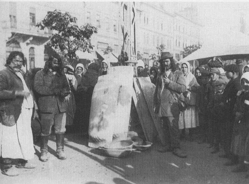
Az „ideáltípus” a szolgálatkész, törvénytisztelő... törekvő, szorgalmas munkálkodó ember alakja (Poroszló, 1965, Kaposvár, 1909)

nagy feladat megoldásának előkészítése céljából először is egy általános cigányösszeírásra gondolt.”