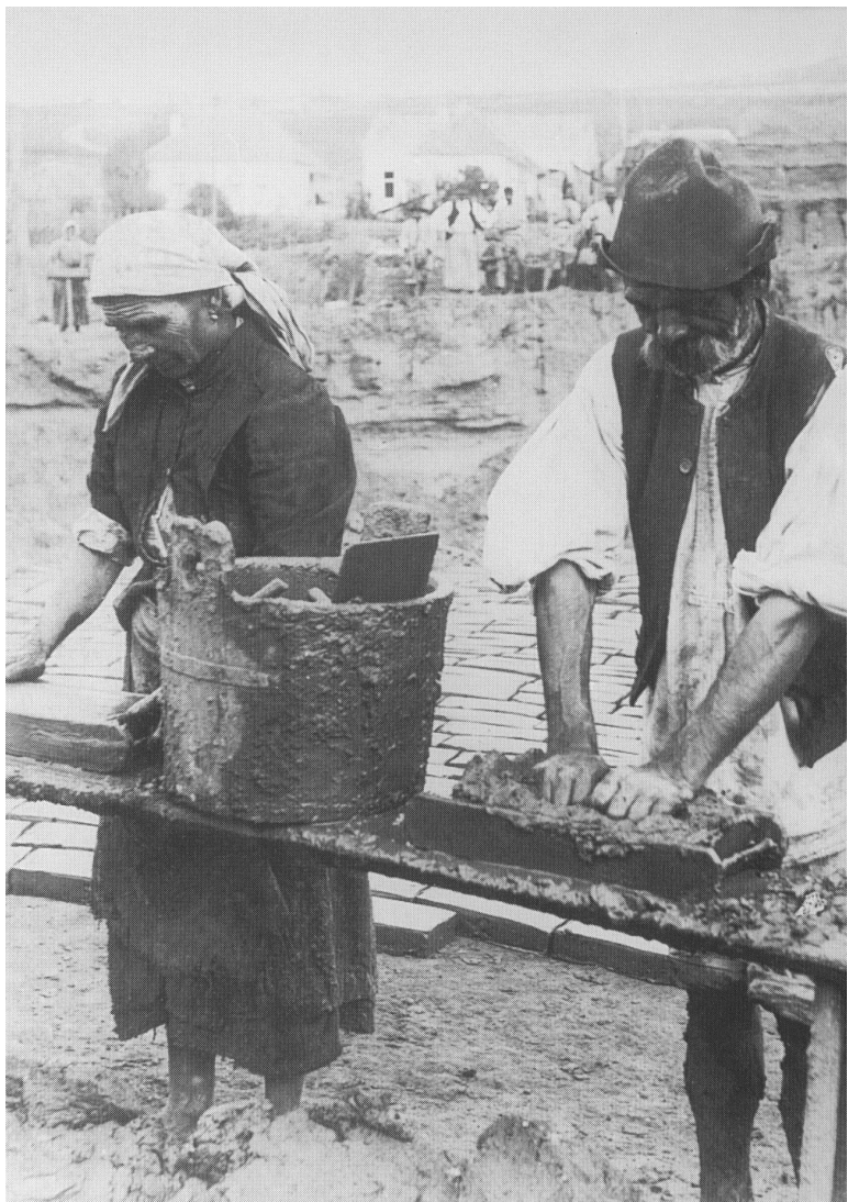
Téglavető magyar cigányok (romungrók) (Adler Artúr felvétele, Csíkszereda, 1911)

A főbb oláh (vlax) cigány nemzetségek a következők: Hercegešt'e (Herceg-