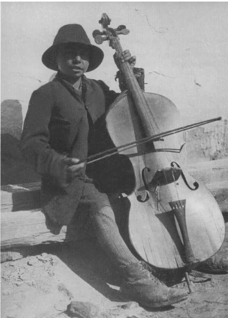
„Minden muzsikos magyar cigány, de nem minden magyar cigány muzsikos” (Fényes Dezső felvétele, Patak, 1934)

denciákat figyelhetünk meg. Szinte kivétel nélkül minden magyar cigány muzsikusként definiálja magát, függetlenül attól, hogy foglalkozását tekintve maguk vagy közvetlen felmenőik zenélésből éltek-e. Így akik korábban vályogvetők, napszámosok vagy az elmúlt időszakban akár ipari, vagy mezőgazdasági munkások voltak, magukat így minősítik. Értelmezésükben a muzsikos egyfelől egy leszármazási rendet jelent, hiszen valamelyik mitikus ősz muzsikos volt, másfelől egy olyan csoportelnevezést, amelyik egységesen minden magyar anyanyelvű — és nem oláh, nem teknővájó cigányra — vonatkoztatható. A magukat igazi muzsikusnak tartók jobbára elhatárolódnak ettől a megfogalmazástól és a „minden muzsikos magyar cigány, de nem minden magyar cigány muzsikos” elv hangoztatásával a csoportelnevezést egyértelműen szűkítik. Az igazi muzsikosok jó életértelmezése jóval közelebb áll az „igazi művész” vagy korábbi megfogalmazásokból táplálkozva az úri (nemesi-dzsentri) életfelfogáshoz. Eszerint az igazi zenész másoknak megadja a tiszteletet, bőkezű, vendéglátó, adakozó, s éppen ezáltal ér el szimbolikus fölényt. Jóllehet, megélhetése a paraszttól, illetve a