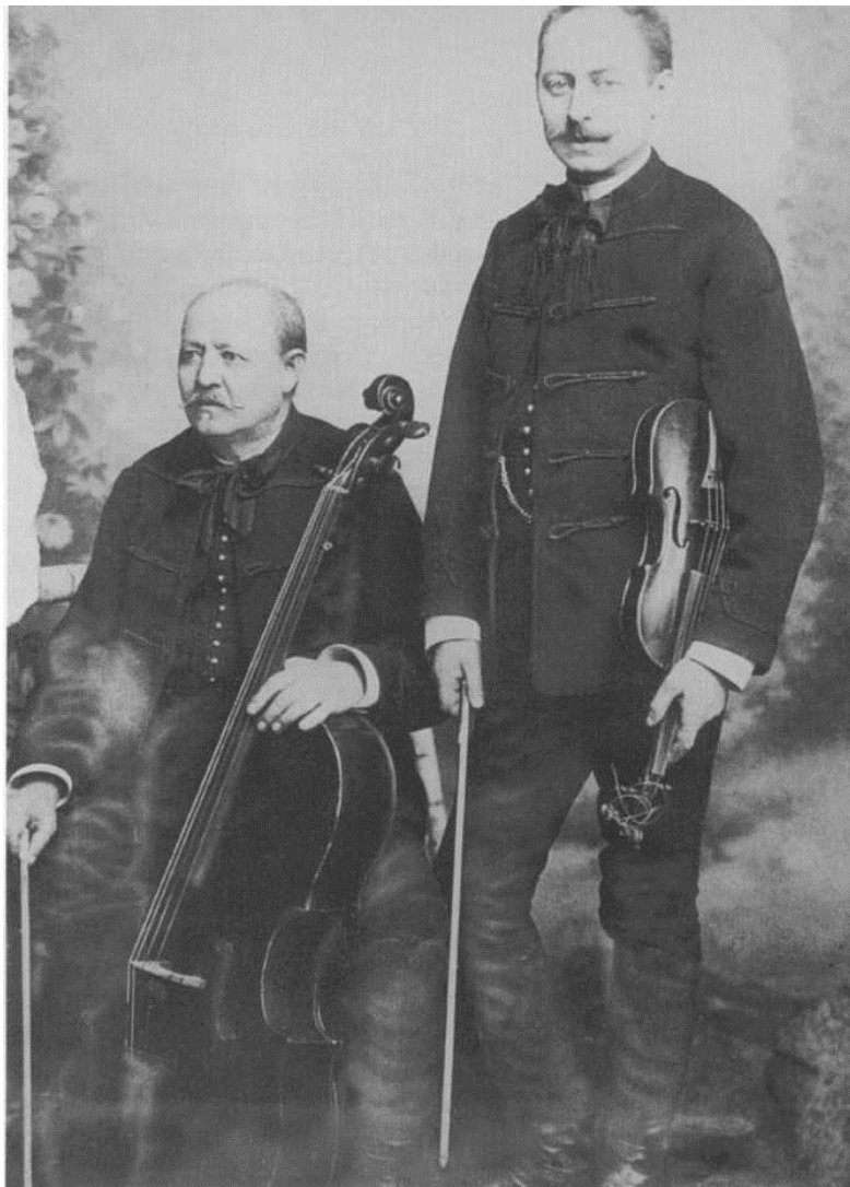
Vidéki városokban és a fővárosban élő, zenével foglalkozó cigányok, akik a zene kategóriában magasabb elbírálást nyertek (1870-es évek)

Legfontosabb szociológiai tényként azt kell rögzíteni, hogy a három fő csoport között merev házassági — endogám — kör húzódik, sőt ez adott fő csoporton belüli alcsoportokra is kiterjedhet, ami egész pontosan azt jelenti, hogy az egyes csoportokhoz tartozó egyének csak adott csoporton belül házasodnak. Magukat muzsikusnak vagy romnak gondoló csoportokon belül is húzódhatnak merev vonalak. Ezen alcsoportok elkülönülhetnek foglalkozási, életmódbeli, vagyoni, térbeli ismérvek alapján, de nemzetségek, rokonsági rendszerek alapján is. A társadalmi elkülönülés másik pregnáns megnyilvánulása az adott településen belüli térbeli elkülönülés, amikor két vagy három fő csoport képviselői a település más-más részén helyezkednek el, nem „keverednek”, vagy ha adott településen belül egy telep létezik, akkor azon belül írható le egy osztott és egymás között képzeletbeli határvonallal elválasztott terület. A fő csoportok elkülönülését megfigyelhetjük a munkaszervezeti formákban is. A korábbi évtizedekben a különböző munkahelyeken az egyes csoportok tagjai jobbra külön-külön munkabrigádba tartoztak, a munkásszálláson lehe-