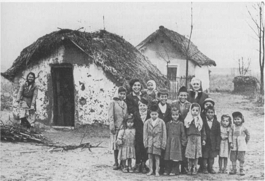
...a különféle típusú kisebbségek között leghátrányosabb helyzetű a cigányság... (Képek egy tanácsi fotóalbumból, 1957)

a politikai nemzethez tartozásként, hanem etnikus akarták meghatározni önmagukat, s naponta szembesültek azzal, hogy a társadalom többsége „lecigányozza” őket. Céljuk a teljes kulturális alkalmazkodás és hasonulás volt, törekvéseiket azonban mégsem kísérte siker. Igazolja ezt az is, hogy az 1971-es, majd az 1993-as szociológiai felmérés — miként az első magyarországi cigányösszeírás 1893-ban is — azt tekintette cigánynak, akit a társadalom többsége cigánynak tart. Érzékelhető a helyzet paradox volta. Hasonló mondható el akár az iskolai statisztikai gyűjtőlapokról is, ahol az iskola,