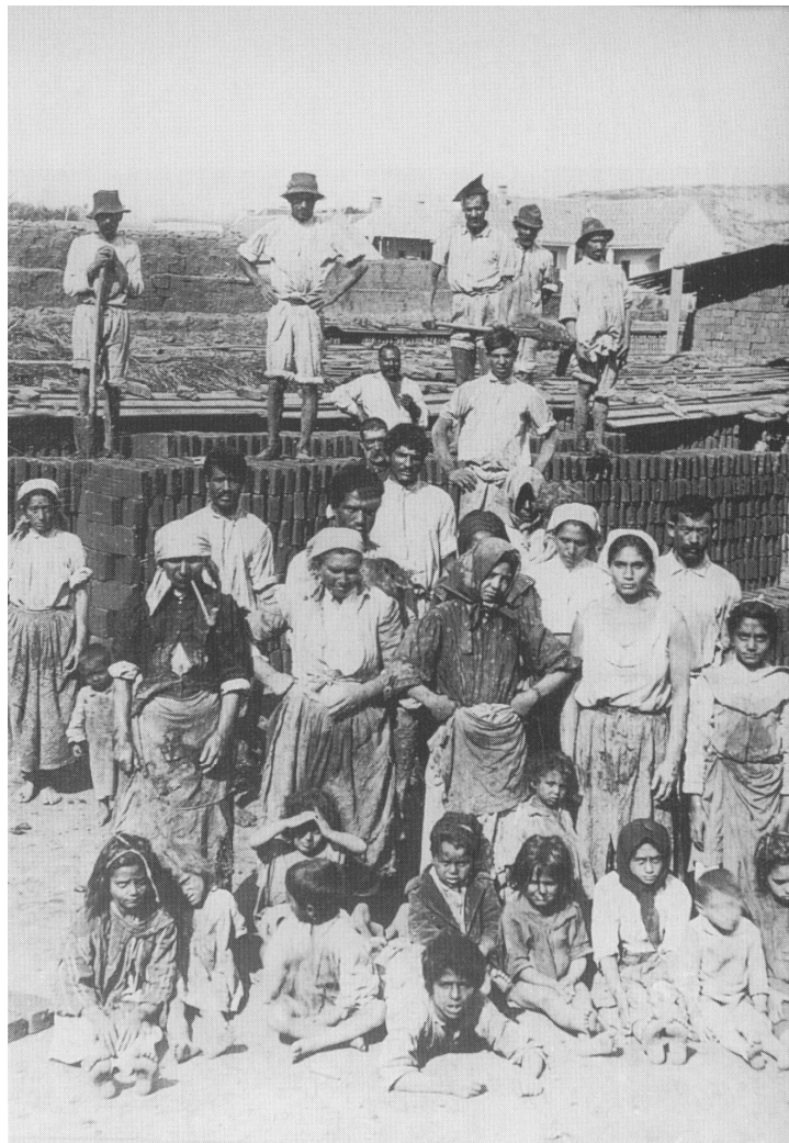
A 19. század cigányságképe (Adler Artúr felvétele, Csíkszereda, 1911)

„...a midőn a csavargás ügynek országos rendezését és ezzel kapcsolatban a kóbor cigányok letelepítésének kérdését a belügyminisztérium munkaprogramjába felvette, biztos tekintettel azonnal felismerte a legsürgősebb teendőt, s a kitűzött